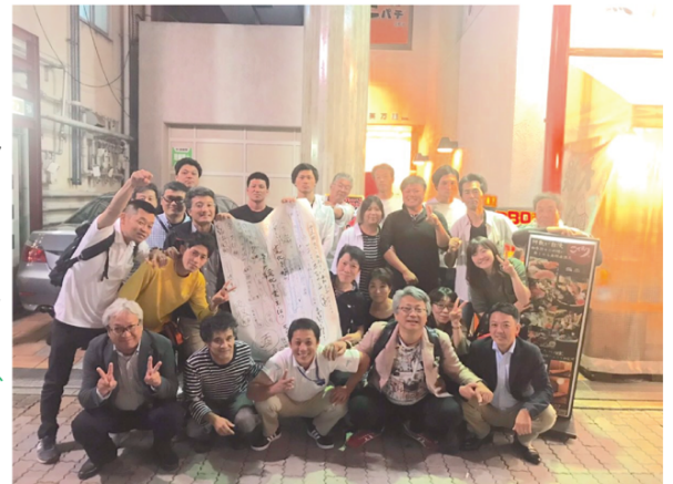
皆さんとってもいい笑顔!これからも笑顔で頑張ってください!