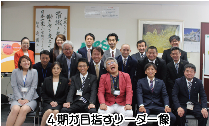
4期が目指すリーダー像

これから約1年、「目指すリーダー像」になれるよう14名の仲間全員で楽しく磨き合いきましょう!!