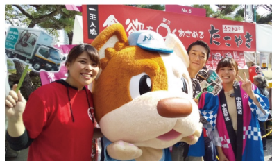
テレビ中継にも来てもらいました!