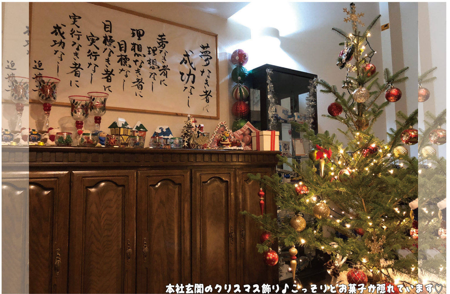
本社玄関のクリスマス飾り♪こっそりとお菓子が隠れています♡